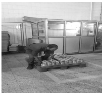
سچر کارگر در حال چیدن بسته های مواد غذایی روی پالت

بر اساس توصیه نایوش (NIOSH) مقدار نیروی فشاری کمتر یا مساوی ۳۴۰۰ نیوتن بیانگر ریسک پایین آسیب کمر، ۳۴۰۰ تا ۶۴۰۰ نیوتن ریسک آسیب کمر متوسط و مقدار بالاتر از ۶۴۰۰ نیوتن ریسک آسیب کمری زیاد می شود و نیروی برشی کمتر یا مساوی ۵۰۰ نیوتن ریسک آسیب به کمر پایین و بالاتر از این مقدار ریسک آسیب کمر زیاد می گردد (۱۵).