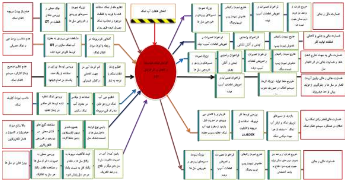
شکل ۲: دیاگرام پیشنهادی مطلوب Bow-Tie کاهش غلظت آب نمک و ریسک انفجار مخزن ذخیره کلر به دلیل افزایش فشار هیدروژن