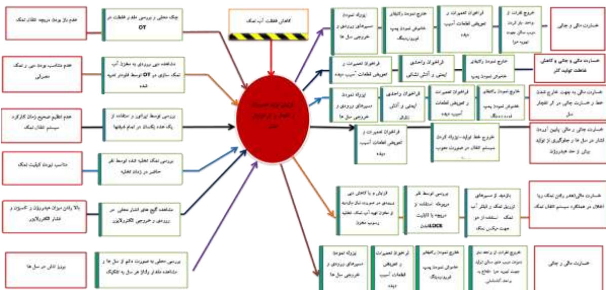
شکل ۱: دیاگرام Bow-Tie کاهش غلظت آب نمک و ریسک انفجار مخزن ذخیره کلر به دلیل افزایش فشار هیدروژن

تحلیل ریسک های شناسایی شده به روش Bow-Tie پس از بررسی ریسک های محتمل واحد، شناسایی رویدادهای مهم (Top Event) ناشی از نتایج ارزیابی ریسک به روش HAZOP، ۷ رویداد مهم شامل ریسک ترکیب در مسیر های