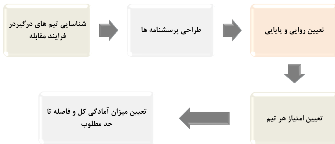
شکل ۱: مراحل انجام مطالعه

بعد از اطمینان از روایی و پایایی پرسشنامه‌های طراحی شده، پرسشنامه‌ها بین پرسنل واحدهای مختلف پخش شد. در مطالعه حاضر، امتیاز میزان آمادگی هر تیم با استفاده از پرسشنامه‌های طراحی شده به صورت جدا تعیین شد و میانگین امتیاز این تیم‌ها به عنوان امتیاز کل سیستم در نظر گرفته شد. میزان فاصله تا رسیدن به حد مطلوب آمادگی بر اساس اختلاف بین میزان آمادگی قابل دسترس سیستم (امتیاز ۱۰۰) و امتیاز حال حاضر کل سیستم بدست آمد. در واقع