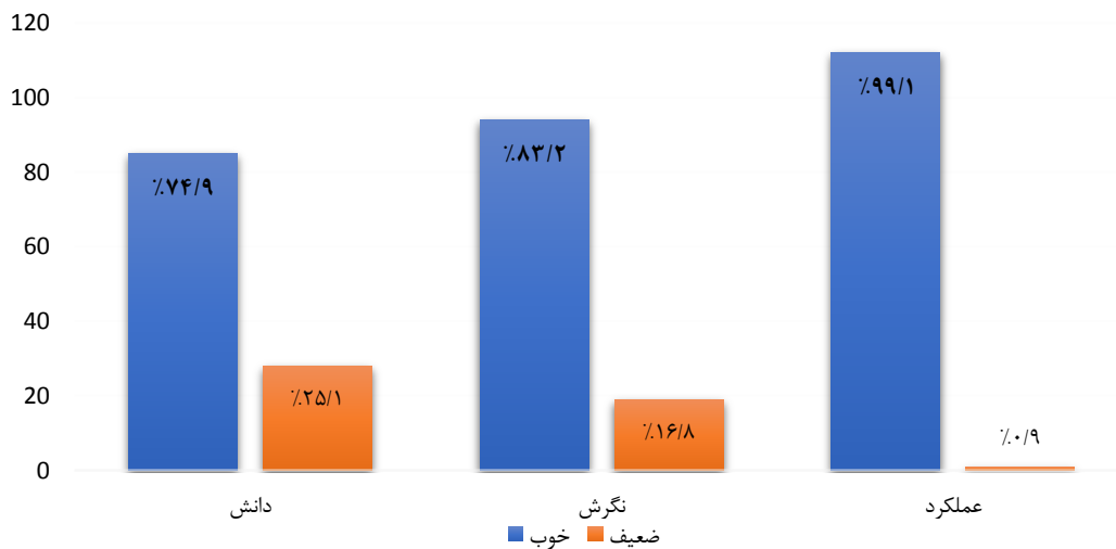
نمودار ۲: سطح دانش، نگرش و عملکرد پرسنل مورد بررسی

بر اساس نتایج بدست آمده از این مطالعه، ۷۴/۹٪ افراد مورد مطالعه از دانش خوب و ۲۵/۱٪ افراد از دانش ضعیفی برخوردار بودند. ۸۲/۲٪ افراد مورد مطالعه دارای نگرش خوب و ۱۶/۸٪