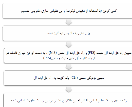
شکل ۱: مراحل اجرای روش تاپسیس

تاپسیس یکی از روش های مهم و پرکاربرد در بین روش های تصمیم گیری چند معیاره می باشد که توسط یون و یوانگ ابداع شده است (۶). روش تاپسیس به عنوان یکی از تکنیک های تصمیم گیری چند معیاره بر این اصل استوار است که گزینه های انتخاب شود که کوتاهترین مسافت را از راه حل ایده ال مثبت و در عین حال دورترین مسافت را از راه حل ایده ال منفی داشته باشد. همچنین این روش با غلبه بر تضاد و تناقض های بین معیارها، ابزاری موثر برای پشتیبانی از اولویت انتخاب شده می باشد. مراحل رتبه بندی مخاطرات شناسایی شده توسط روش تاپسیس به صورت خلاصه در شکل ۱ آمده است.