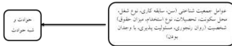
شکل ۱: مدل مفهومی رابطه عوامل شخصیت و جمعیت شناختی با حوادث و شبه حوادث را نشان داده است (مدل مفهومی پژوهش)