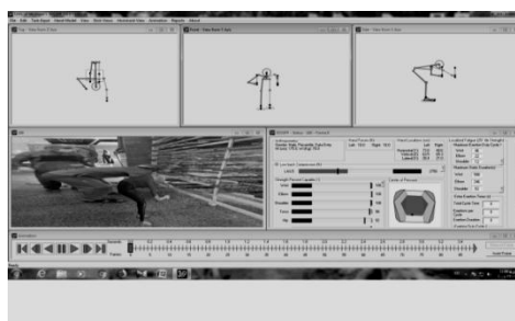
تصویر ۲: پوسچر شبیه سازی شده کارگر در حال بلندکردن بار در نرم افزار 3DSSPP