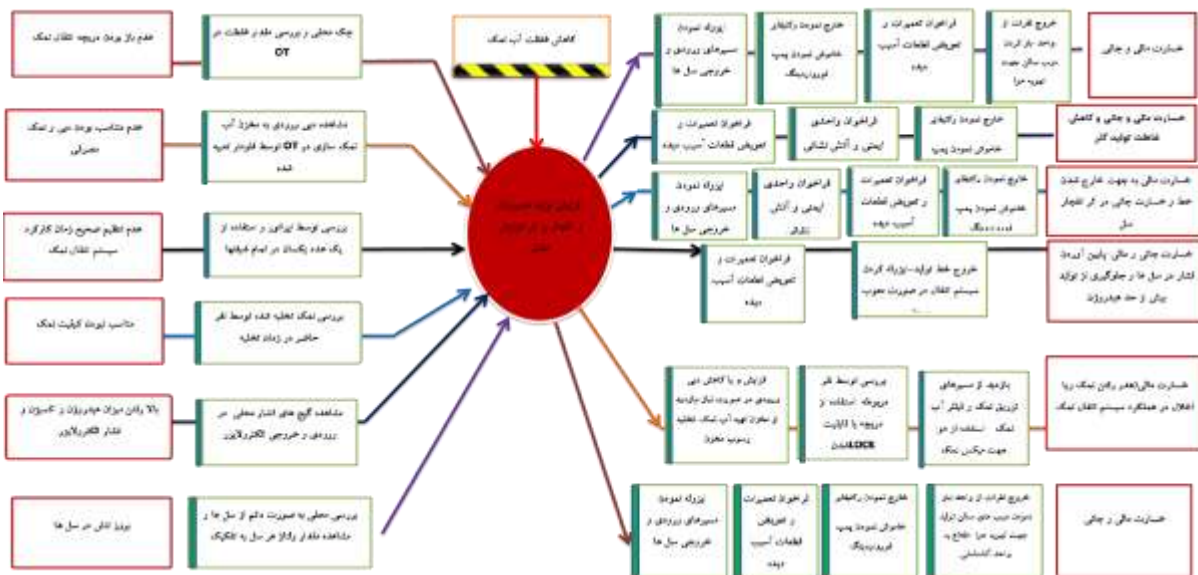
شکل ۱: دیاگرام Bow-Tie کاهش غلظت آب نمک و ریسک انفجار مخزن ذخیره کلر به دلیل افزایش فشار هیدروژن

تحلیل ریسک های شناسایی شده به روش Bow-Tie پس از بررسی ریسک های محتمل واحد، شناسایی رویدادهای مهم (Top Event) ناشی از نتایج ارزیابی ریسک به روش HAZOP، ۷ رویداد مهم شامل ریسک ترکیب در مسیر های