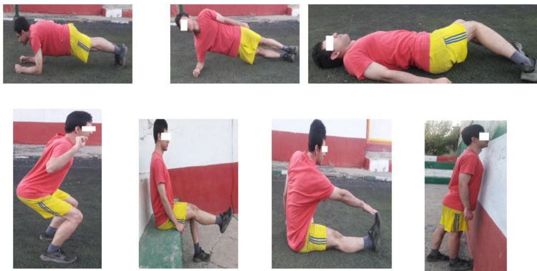
شکل ۱: نمونه‌ای از تمرینات اصلاحی انجام شده

لازم به ذکر است که افرادی که به هر دلیلی قادر به انجام این تمرینات نبودند تمرینات مشابه و باهدف یکسان انجام گرفت. همچنین با افزایش توانایی‌های افراد تمرینات سخت‌تر (شدت و