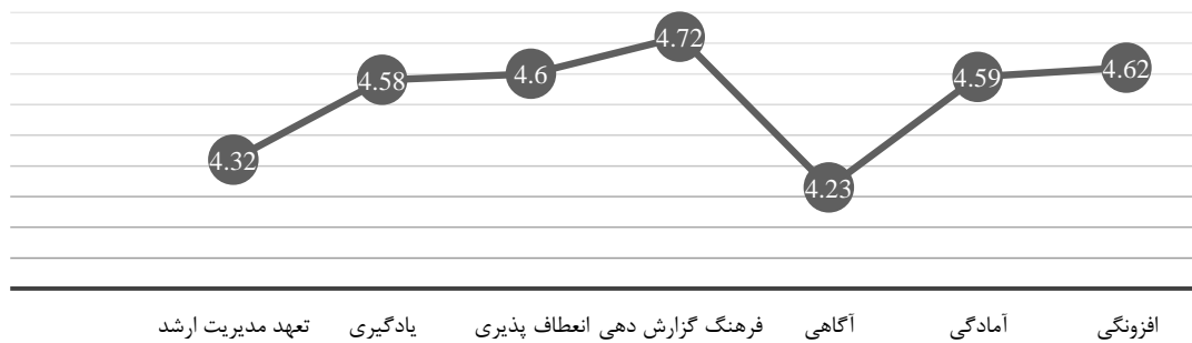
شکل ۲: وضعیت مهندسی تاب‌آوری

نمود. نتایج آزمون تی تک نمونه‌ای مبتنی بر وضعیت شاخص‌های HSEE در جدول ۲ ارائه شده است. ملاحظه می‌گردد که میان وضعیت موجود و وضعیت مطلوب برای هر یک از مؤلفه‌های مهندسی تاب‌آوری تفاوت معنی‌داری وجود دارد؛ که نتایج در شکل ۳ ارائه شده است.