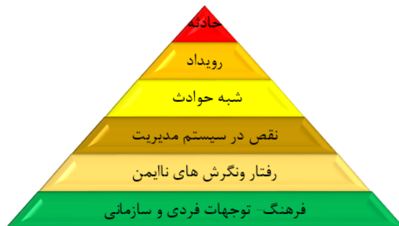
شکل ۱: ارتباط فرهنگ، سیستم مدیریتی و حوادث در سازمان

رفتارهای نایمن و فرهنگ مقصر یابی میباشد [13] ارتباط بین حوادث و رویدادها و سیستم مدیریت ایمنی و درک و نگرش و آگاهی در بین افراد یک سازمان و فرهنگ ایمنی در سازمان به