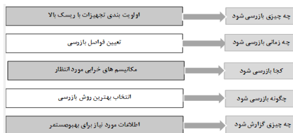
شکل ۱: نتایج ارزیابی RBI برای برنامه‌های بازرسی

RIMAP) را تایید کرد (۲۸). روش بازرسی بر مبنای ریسک برای سیستم‌های تحت فشار شامل: لوله‌ها، مبدل‌های حرارتی، مخازن ذخیره، مخازن تحت فشار و فیلترها قابل اجرا می‌باشد و به منظور انجام آنالیز RBI برای هر مورد، ریسک خرابی پس از تعیین احتمال وقوع خرابی و پیامد وقوع خرابی به صورت جداگانه و از ترکیب این دو فاکتور محاسبه می‌شود (۲۹). تکنیک بازرسی مبتنی بر ریسک، از روش‌های رسمی تعیین ریسک برای تصمیم‌گیری در خصوص برنامه‌های بازرسی استفاده می‌کند (۳۰). شکل ۱ نتایج ارزیابی RBI برای برنامه‌های بازرسی را نشان می‌دهد (۲۹).