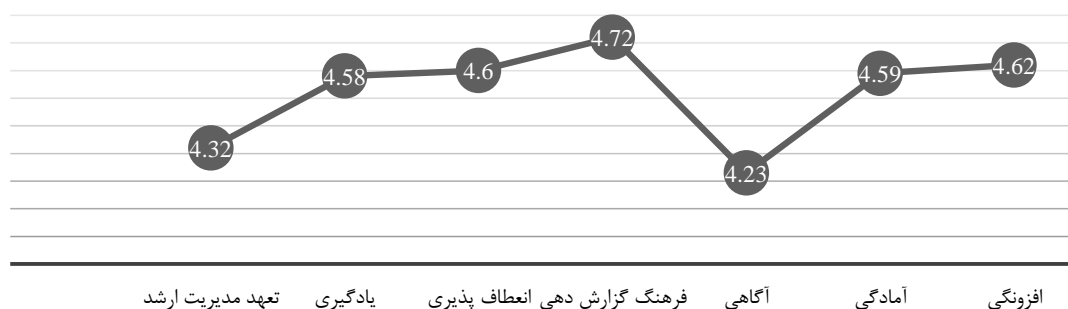
شکل ۲: وضعیت مهندسی تاب‌آوری

نمود. نتایج آزمون تی تک نمونه‌ای مبتنی بر وضعیت شاخص‌های HSEE در جدول ۲ ارائه شده است. ملاحظه می‌گردد که میان وضعیت موجود و وضعیت مطلوب برای هر یک از مؤلفه‌های مهندسی تاب‌آوری تفاوت معنی‌داری وجود دارد؛ که نتایج در شکل ۳ ارائه شده است.